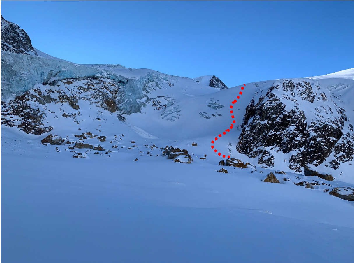
Abb. 1: Empfohlene Routenwahl in Distanz zu drohenden Eisstürzen. Im Vordergrund die Felsmassen der grossen Fels- und Eisstürze von 2019 und 2020. Spuren eines kleinen Eissturzes.

Felssporn und genügender Distanz zu den Seracs (siehe Abb. 1). Eisstürze sind jederzeit möglich. Diese objektive Gefahr ist schwer einschätzbar. Die weitere Entwicklung in Folge des Gletscherrückgangs muss verfolgt werden. Es ist zu erwarten, dass die Verhältnisse hier in den kommenden Jahren schwieriger werden.